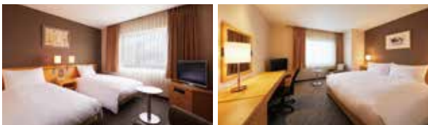
スタンダードツイン