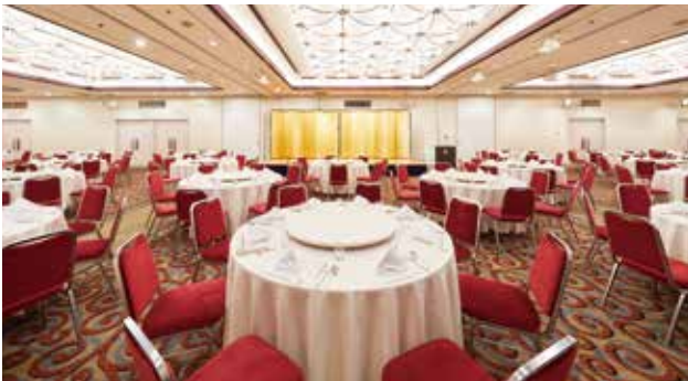
2F ロイヤルプリンセス