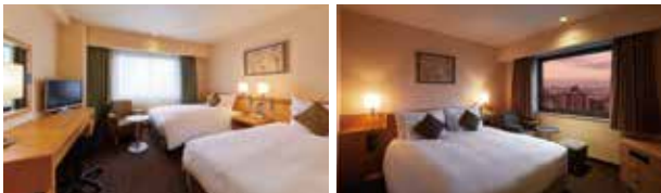
スーパーリアーツイン