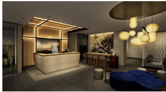
宿泊者専用ラウンジ “まち”との交流や寛ぎの場となる茶邸のリビング