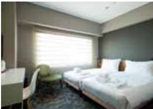
프리미엄 시티 트윈