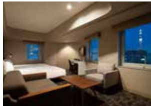
프리미엄 스카이츠 인