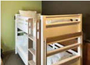
슈퍼리어 뱅크 베드