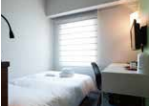
스탠다드 세미 더블