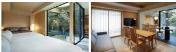
プレミアスイート