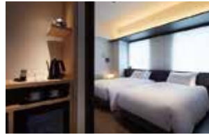
角隅雙床房 (無障礙房)