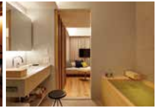
프리미엄 더블룸 (편백나무 욕조 포함)