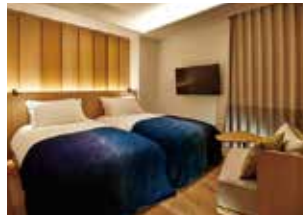
디럭스 트윈룸 (편백나무 욕조 포함)