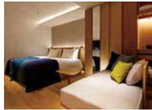
프리미엄 트윈룸 (편백나무 욕조 포함)